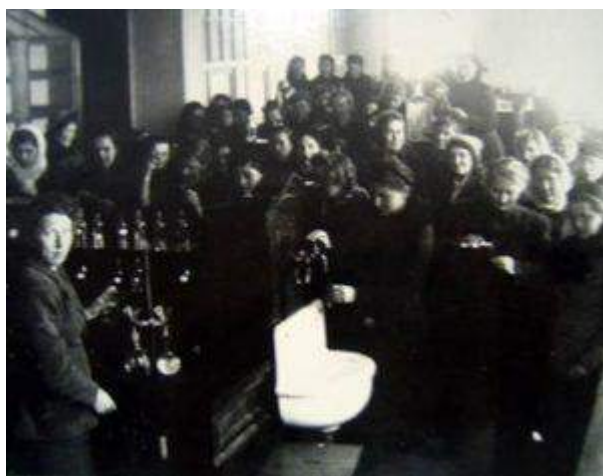
Так виглядали заняття студентів на кафедрі мікробіології ЧМІ у 1945 р.