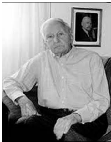
Одна з останніх фотографій М. Б. Маньковського