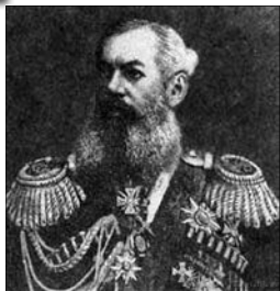
Дід – Микита Іванович Маньковський

Лікарська династія Маньковських – одна з найбільш вражаючих серед інших династій медиків України. Її родоначальником був великодосвідчений військовий лікар, випускник знаменитої Санкт-Петербурзької Медико-хірургічної академії – Микита Іванович Маньковський.