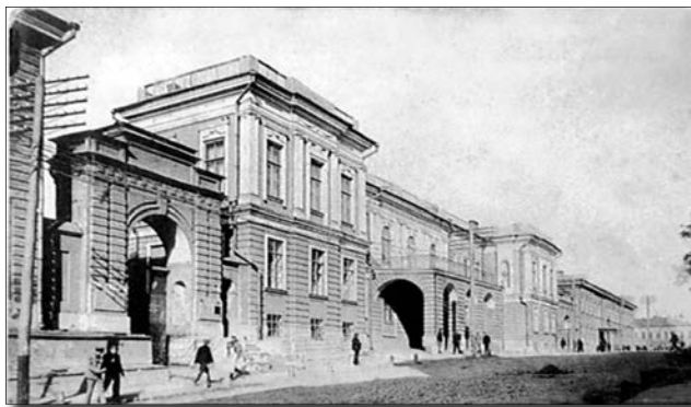
Харківський університет (Старий корпус)