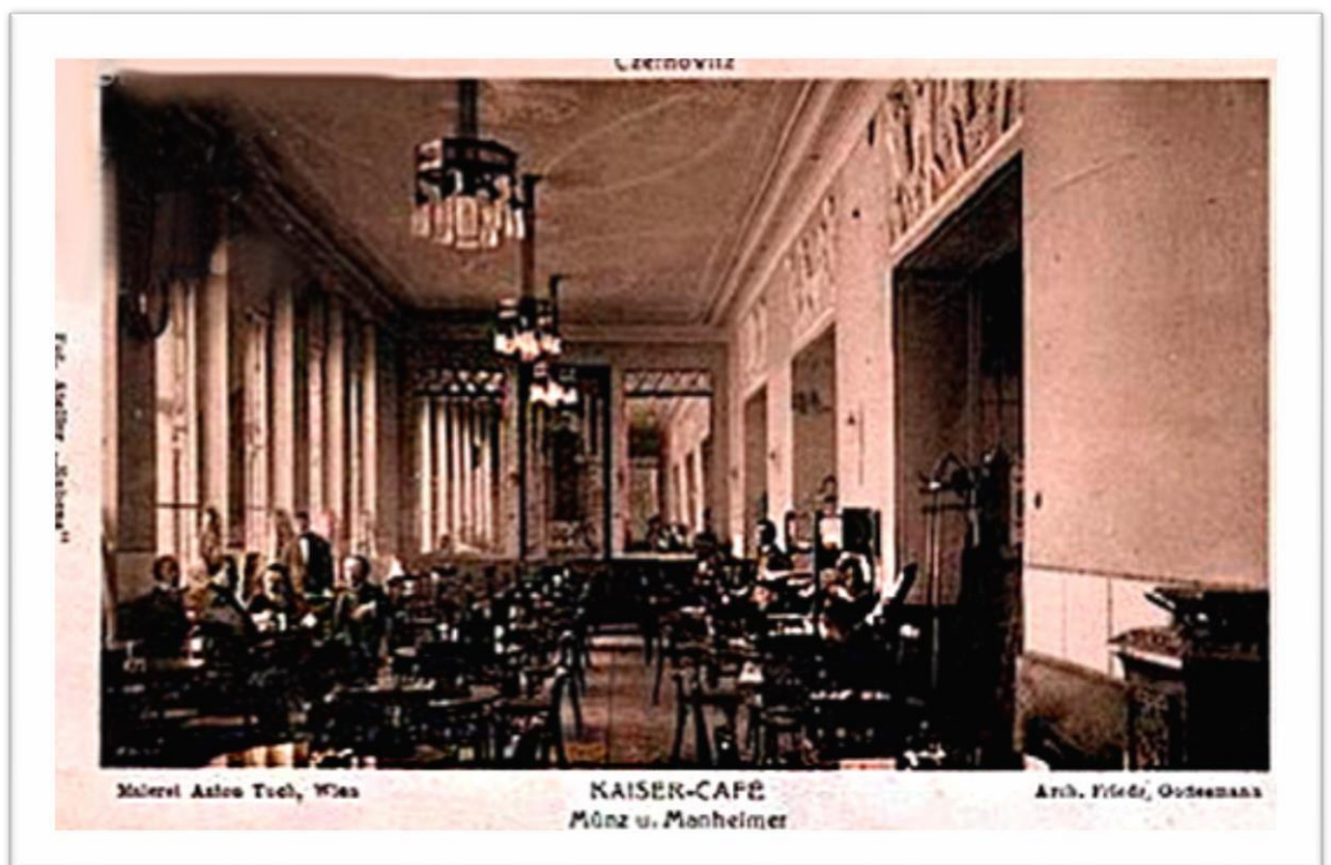
Майже весь перший і цокольний поверхи будівлі торгової палати займав постійно діючий (називали зимній) зал кав'ярні «Кайзер». У 1944 – 1968 роках в цих приміщеннях розміщався спортивний зал Чернівецького медінституту. Нині знаходяться приміщення деканатів медуніверситету. Фото 1912 р.