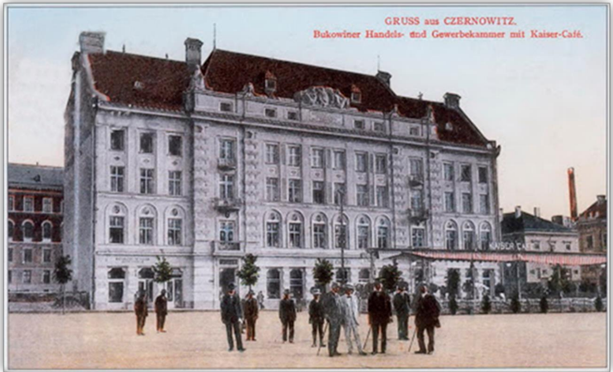
Будівля торгової палати, а перед нею - намет літньої кав'ярні «Кайзер». Фото 1912 р.