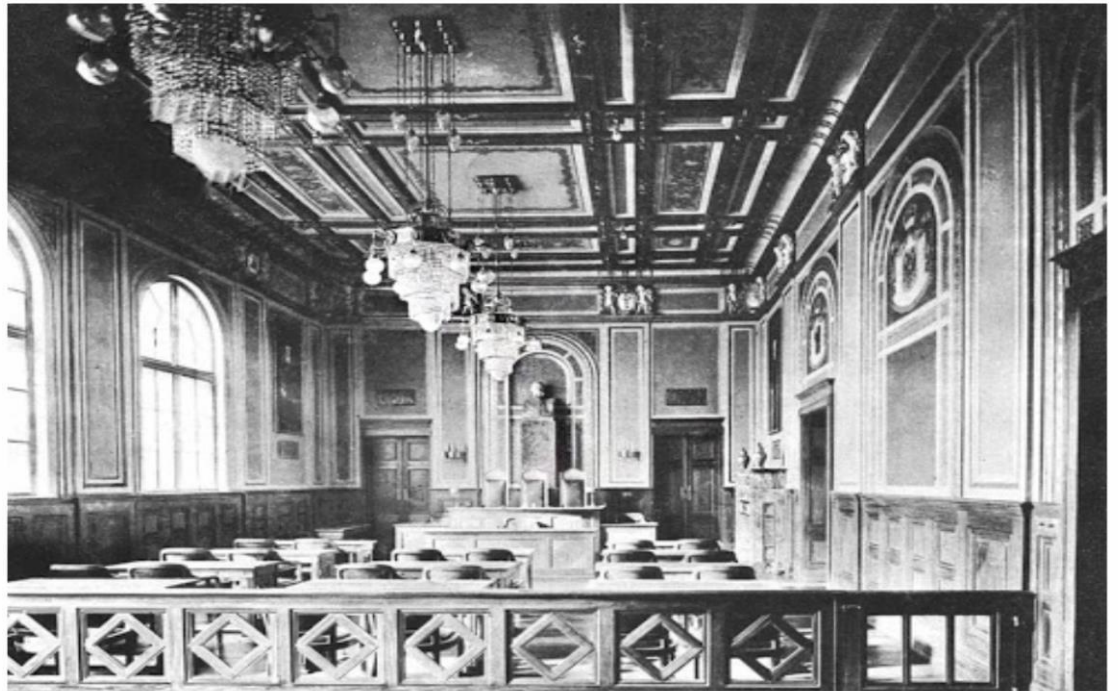
Зала засідань торгової палати (нині конференцзал БДМУ). Фото 1912 року